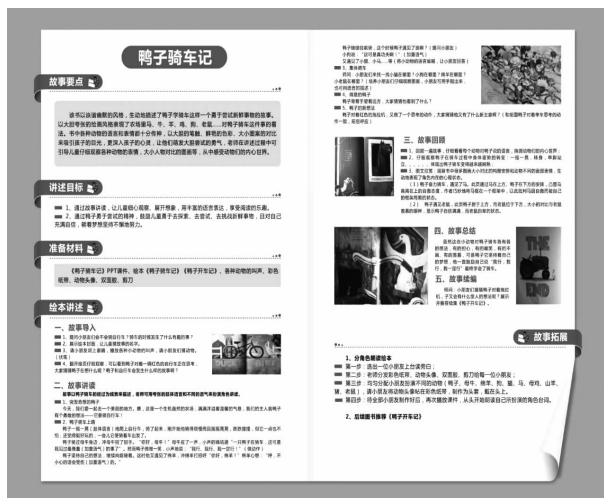
图4 《布客儿童阅读推广服务手册》内页