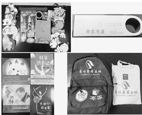
图2 儿童阅读推广文化志愿服务工具包所含资料