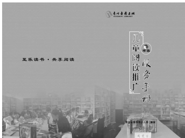
图3 《布客儿童阅读推广服务手册》封面

如为低幼儿童讲述《鸭子骑车记》时,故事的导入设计了多种方法,方法一是引导孩子观察图书封面,提问孩子们看到了什么,激发其想象力去想象会发生什么故事;方法二请孩子闭上眼睛,播放U盘里各种小动物的叫声,让其猜测是什么动物,为将要出现的动物埋下伏笔;方法三是提问孩子会不会骑车,骑车的时候发生过什么有趣的事。工具包里提供很多故事导入的方法供志愿者针对不同年龄段孩子讲述时参考使用。第二部分为操作资料,配齐活动实操中使用的资料,包括绘本、课件、音视频、活动拓展物品等。例如在讲述富有哲理性的绘本《安的种子》时,准备了多个品种的花种,并在拓展活动中将种子分发给听故事的每一位孩子,让孩子们在实践中体会种植的过程,亲身感受顺应万物生长规律的重要性。两个部分实现了“活动指南”与“活动材料”的无缝对接,工具包的设计让公共文化资源得以共享,让本土文化志愿者开展绘本故事会活动时更专业便捷。