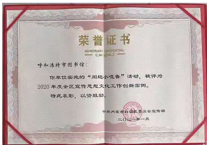
图 4-23 “阅趣小嘎鲁”荣誉证书

2021年1月，“阅趣小嘎鲁”品牌活动被评为“2020年度全区宣传思想文化工作创新案例”，同时呼和浩特市图书馆还被自治区妇女联合会选定为“自治区家庭亲子阅读体验基地”。