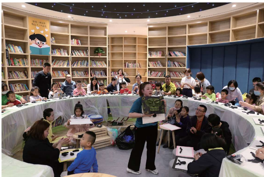
图 4-21 第 49 期“阅趣小嘎鲁”活动现场

2. 兼顾思想性和趣味性。少儿阅读一般止步于阅读环节，通常很少有手书心得等读后环节，加上对选题策划和导读环节重视不够，少儿阅读普遍存在着随意性、浅层次、忘得快和持续性弱的缺点。“主题策划”环节是由市图书馆汇总各方意见，精选不同阅读主题，遴选相关读本作为相应的阅读推广篇目，精心策划实施方法及步骤；“内容导读”环节引导少儿读者深入理解读本的思想内涵与艺术特点，有效克服了少儿阅读的浅层次；读后的“手书心得”环节引导少儿接受传统文化的熏陶，将思考后的心得体会手写成书信，既巩固了少儿记忆，还培养了书面表达能力；“小嘎鲁传书”环节是市图书馆一方面为少儿读者创造现场与他人交流读后感的条件，一方面倡导将少儿书信作品邮寄到市图书馆，由市图书馆挑选优秀手书作品进行展陈，既有利于扩大阅读分享范围，也能引导家长持续支持少儿阅读，激发少儿向身边小读者学习、赶超的心理，增强少儿阅读的主动性、持续性。