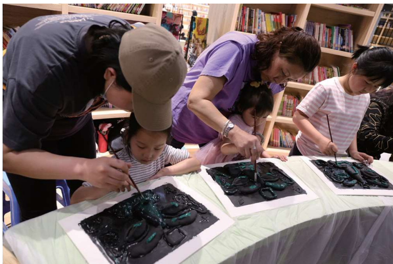
图 4-22 第 49 期“阅趣小嘎鲁”活动现场

3. 发挥空间优势，优化阅读环境。古有孟母三迁，择邻而居的故事，说明环境对于少儿成长的重要性。“阅趣小嘎鲁”充分发挥公共图书馆的空间优势、藏书优势、技术优势和人文优势，2018 年投资 100 多万元，对 200 平方米的亲子阅览室进行空间再造，更新了投影机、电视机和计算机设备，优化了功能分区、色彩搭配、采光、资源结构，使得亲子阅览室环境更加舒适、优雅、富有童趣和人文气息。良好的阅读环境，发挥了自身的文化熏陶作用，吸引了很多家长 and 少儿，使得“阅趣小嘎鲁”系列阅读活动有了很好的人气基础。